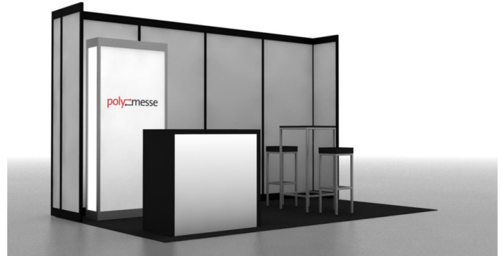
Abbildung zeigt einen Messestand mit Mietmobiliar